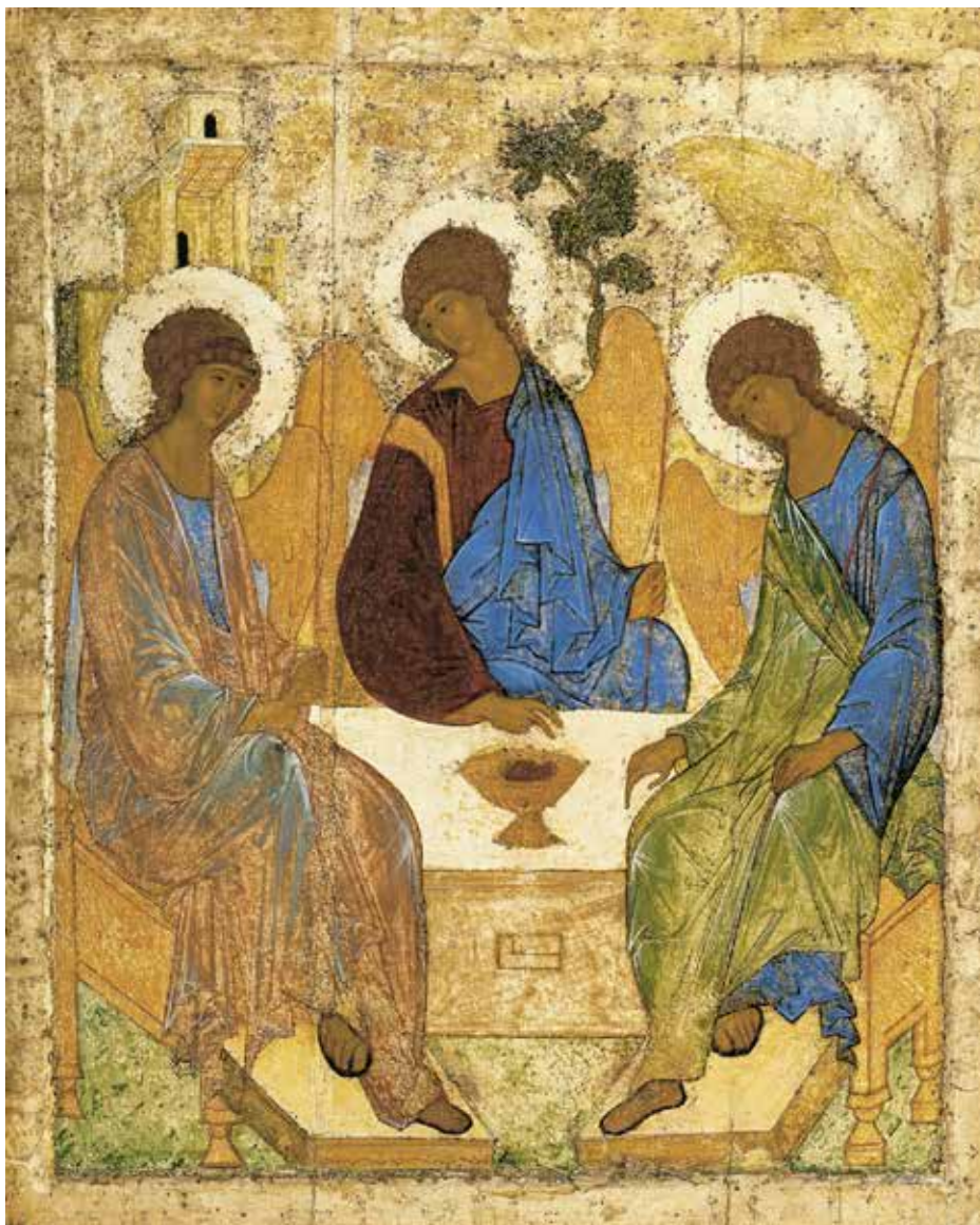
Andrei Rublev: Angels at Mamre (Holy Trinity)

Tanken om, at Gud kommer til mennesker i skikkelse af en fremmed, er ikke enestående for kristendommen. Det gamle græske heltekvad 'Odysseen' rummer en række eksempler på, hvordan guderne