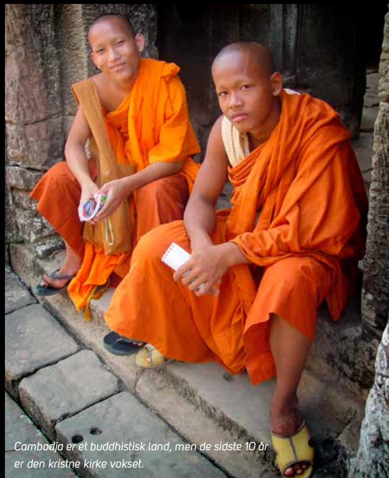
Cambodja er et buddhistisk land, men de sidste 10 år er den kristne kirke vokset.