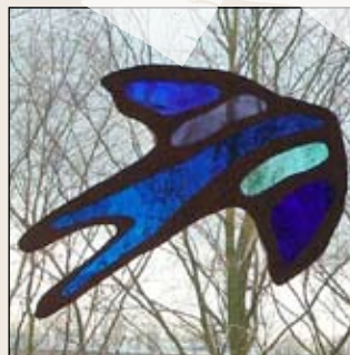
Side 4-6: "Himlens døtre", skulpturer i glas

En af respondenterne siger: "Jeg oplevede det meget tydeligt sådan, at jeg ikke bare kunne blive kristen og så lade tingene være, som de altid har været. Det kom selvfølgelig lidt hen ad vejen. Men for mig var der ingen tvivl om, at Gud ved, hvad der er bedst for mig, og derfor måtte jeg gøre, som Gud gerne vil have det, selv om jeg ikke altid selv forstod det."