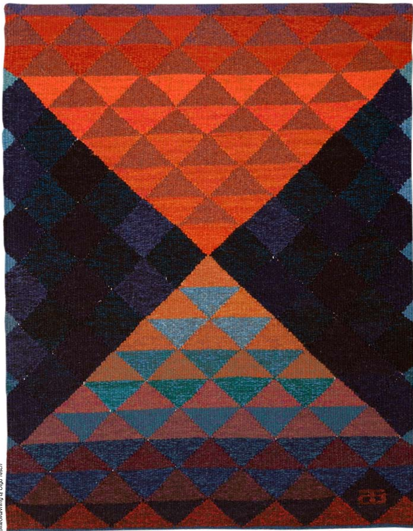
Billedvævning af Olga Tesch