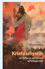
Kristusmystik af Uffe Kronborg 160 sider, 199,95 kr. Credo 2008

søgen efter sandheden og samtidig fastholde, at vi aldrig finder Gud uden om eller bag ved Guds ord.